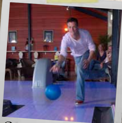
Bowlen bij Stoetenslagh! Vraag naar onze arrangementen

... de Stoetenslagh coffee echt heerlijk is! ... er in alle vakanties fantastische entertainment shows zijn!