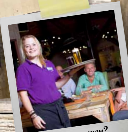
Freestje geven? Vraag naar onze arrangementen

de kenner 10 tapas 5 x koud nr. 1, 5, 7, 8, 9 5 x warm nr. 25, 28, 30, 33, 34 voor 2 pers. € 45,-